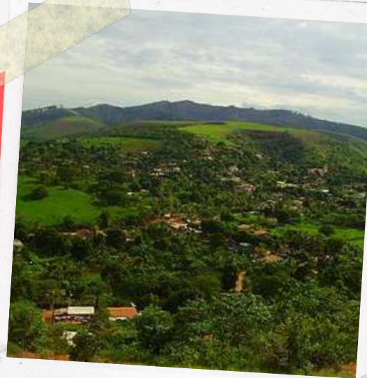
Vista parcial de Xonin

não seria usado para fins agrícolas. Nele seria formada uma vila onde os trabalhadores da fazenda poderiam construir suas casas e morar; onde se reservaria espaços para a igreja, escola, correios, etc. Claro, na medida em que o Distrito crescesse, outros espaços poderiam ser necessários. E provavelmente, a “cidade” iria ocupar os espaços das pastagens. Podemos até dizer que Xonin foi um “cidade” planejada.