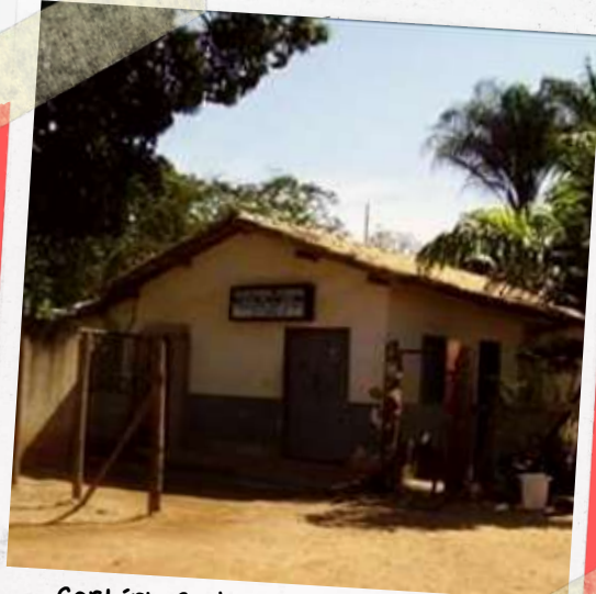
Cartório Cunha (2007)

Xonin tornou-se distrito de Peçanha, através da Lei Estadual n. 843 de 7 de Setembro de 1923. Pelo Decreto-Lei n. 32, de 31 de dezembro de 1937, Peçanha cedeu os distritos de Figueira e de Xonin para formação do território do Município de Figueira. Este recebeu, mais tarde, o nome de Governador Valadares, em homenagem ao governador da época Benedito Valadares Ribeiro.