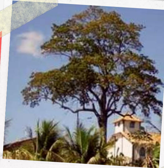
Vista da antiga Peroba

As mulheres cuidavam das crianças que naturalmente, choravam naquela noite escura e cheia de sons estranhos vindos da floresta. Não devemos achar que uma viagem desta era uma viagem de turismo: era uma aventura onde o risco de vida estava presente.