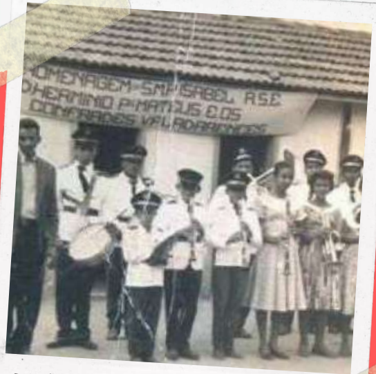
Banda de Música do Distrito

casas, nas vidas das pessoas. Quanto eles chegaram em 1895, certamente trouxeram algumas coisas de Guanhanes, mas com o tempo e com as novidades, a vida nas casas - seja na sede da Fazenda seja nas casas das pessoas mais pobres - foi se modificando. Aqui vale a pena olhar para trás e ver como era simples a vida dos que chegaram em 1895, e como permanecia ainda simples 60 anos depois. O mesmo não podemos mais dizer dos últimos 70 anos: o leitor poderia se perguntar o que em sua casa lembra 1950 e mesmo 1895. Provavelmente a maior parte das coisas que temos em casa são dos últimos 30 anos.