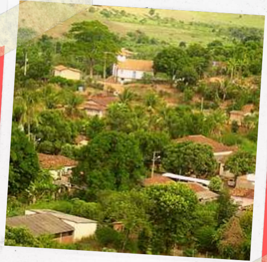
Vista parcial de Xonin

Em tempos remotos, a região da margem norte do rio Doce, entre os rios Suaçuí Grande e o Corrente, que agora compreende a maior parte do município de Governador Valadares, era habitada pelos Botocudos, que caçavam, pescava e cultivavam pequenas roças de mandioca, milho, algodão e urucu. Eles também viviam em constante guerra com os Aimorés, uma outra tribo Botocudo, localizados mais abaixo ao longo do curso do rio Doce.