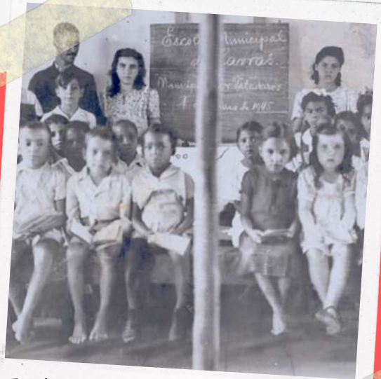
Escola Municipal das Lavras (1945)

O assentamento como um todo, na década de 1950, tinha uma área de 154 km 2 , dos quais, dois km 2 foram destinados as terras do patrimônio nas quais a vila (o atual Distrito) está localizada; o resto das terras compreendia terras de propriedades de fazendas ou de terras reclamadas como tais.