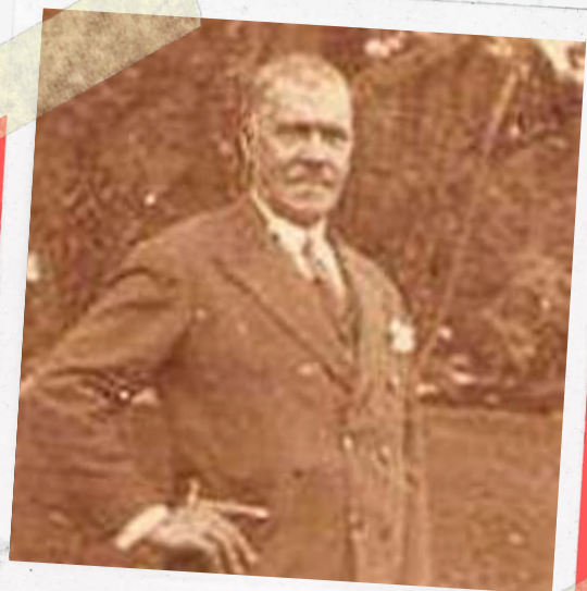
Marcelino Cunha

O Distrito de Xonin não caiu do céu pronto, ele começou há mais de 120 anos. Os primeiros moradores vieram para cá abrindo trilhas no meio da mata e provavelmente andando a pé ou a cavalo. Do primeiro grupo, os que tiveram mais sorte vieram em cima de uma carroça. Não havia casas, não havia estradas e nem animais domésticos. Apenas alguns índios viviam dispersos na região. O que os primeiros moradores encontraram foi muitos animais selvagem e uma floresta imensa.