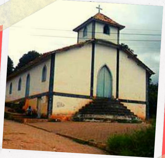
Antiga Igreja de N. S. da Piedade

Para nós hoje em dia é até difícil compreender como era a vida em Xonin 70 anos atrás. Podemos até fazer uma comparação: se uma pessoa que viveu em 1895 chegasse em Xonin em 1950, ela não ia estranhar muitas coisas. Tudo parecia "muito igual" ao do seu tempo. Mas uma pessoa que tenha vivido em 1950 e viesse a Xonin hoje, ficaria espantada com o que via. Vejamos um exemplo: em 1895 e 1950 para a limpeza da roupa, dos cabelos e tudo o mais só existia uma coisa: sabão em barra. Hoje, temos nos supermercados dezenas de metros de gôndolas com produtos diferentes para ocupar o lugar do "pobre e velho sabão".