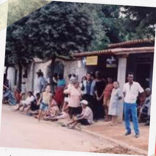
Fila de aposentados (pagamento)

Elas revelam inúmeros aspectos do cotidiano, envolvendo a infância, as brincadeiras, o trabalho na lavoura, as festas e o sentimento de orgulho que cada um deles nutre por ser de Xonin. São histórias de vida generosamente compartilhadas que nos ensinam muito sobre valores, família e fé.