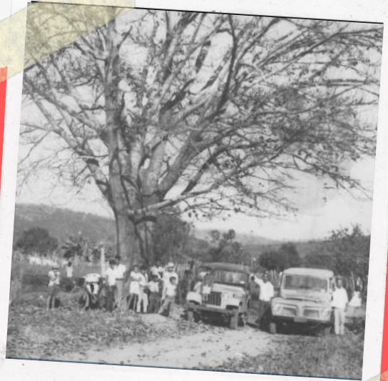
Transporte na Faz. Golconda

Havia inúmeras dificuldades para a introdução de equipamentos mais modernos: a medicina moderna, o uso de métodos de trabalho mais modernos com a terra. Todas as alterações que envolvem mudança sempre encontram resistência. De um modo geral o ser humano é conservador, isto é, ele prefere continuar fazendo o que sabe fazer, com os instrumentos que conhece. Mesmo a mudança simples da máquina de escrever para o computador encontrou resistência especialmente naqueles que estavam acostumados com a máquina.