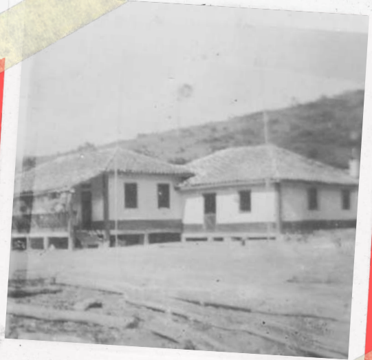
Fazenda em Golconda